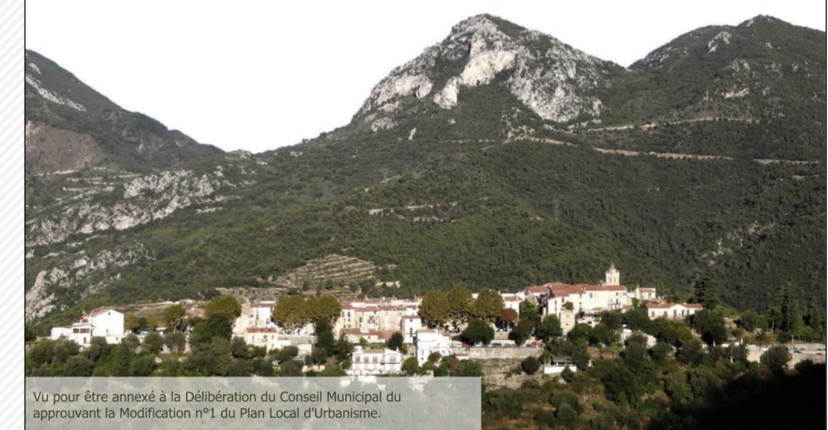
Vu pour être annexé à la Délibération du Conseil Municipal du 14/06/2017 approuvant la Modification n°1 du Plan Local d'Urbanisme.